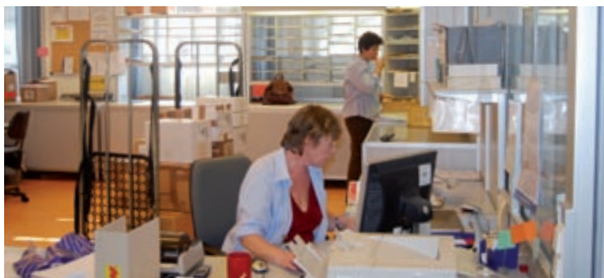
Versandsystem: Bald werden von hier aus auch Messen und Kongresse beliefert.

Im Schnitt 500 Zeitschriften und Zeitungen kommen täglich in der Unnastraße an: einige Dutzend Tageszeitungen für die Vorstands- und Presseabteilungen, Illustrierten-Belegexemplare, in denen Anzeigen oder Werbekampagnen geschaltet wurden, und Abonnements-Zeitschriften für das Marketing, das prüft, ob sich hier die Platzierung von Anzeigen, Beilagen oder Preisausschreiben lohnt. Dann gibt es den großen Bereich der Fachzeit-