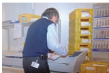
... und der Frankierstation

arbeitet, bezeichnet er sie als Kunden: „Das trifft die Sache besser und zeigt unser Selbstverständnis als Dienstleister.“ Es liegt alles nah beieinander hier im offenen ebenerdigen Großraumbüro: da ist die Rampe, über die ständig Korb- und Rollwagen mit Briefen und Paketen transportiert werden, da gibt es Packplätze für ausgehende Warensendungen, die Frankierstation, die Paketerfassung für den Wareneingang, Regale für die