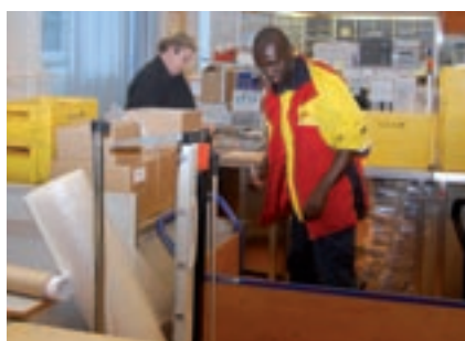
... Pakete und Kuriersendungen DHL.