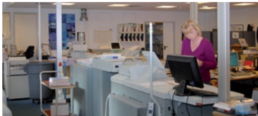
... zum Beispiel mit dem Print Service ....

arbeitet, bezeichnet er sie als Kunden: „Das trifft die Sache besser und zeigt unser Selbstverständnis als Dienstleister.“ Es liegt alles nah beieinander hier im offenen ebenerdigen Großraumbüro: da ist die Rampe, über die ständig Korb- und Rollwagen mit Briefen und Paketen transportiert werden, da gibt es Packplätze für ausgehende Warensendungen, die Frankierstation, die Paketerfassung für den Wareneingang, Regale für die