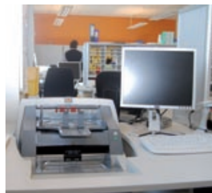
Scannen und Archivieren wird immer öfter nachgefragt.

weltweit mit Proben, Mustersendungen, Sendungen für Werbekampagnen und Gewinnspiele ausgestattet werden. Dafür verlassen monatlich rund 4000 Pakete die Hamburger Poststelle. Gemeinsam mit der Exportabteilung hat man eine Länderinformationsliste ins Intranet gestellt, in der alle Auslandsfrachtbestimmungen aufgelistet sind. So gelten Deosprays wegen der Befüllung mit Druckgas als Gefahrgut. In manchen Ländern droht den Paketen selbst Gefahr: nämlich die des spurlosen Verschwindens. Deshalb werden solche Sendungen in der Poststelle gesammelt und per Kurier versandt – zweimal pro