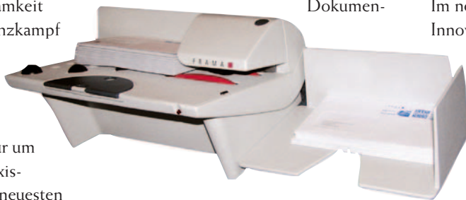
Öffnet 400 Umschläge in der Minute: Access B400 von Frama

geht der Weg in immer mehr Unternehmen. Der erste Schritt zum modernen Capturing ist natürlich das Öffnen der Sendung. Maschinelle Brieföffner avancieren wieder zum Trend-Produkt, zum Beispiel der neue B400 von Frama. Neben Frankier- und Kuvertiermaschinen gehört jetzt auch der leistungsfähige