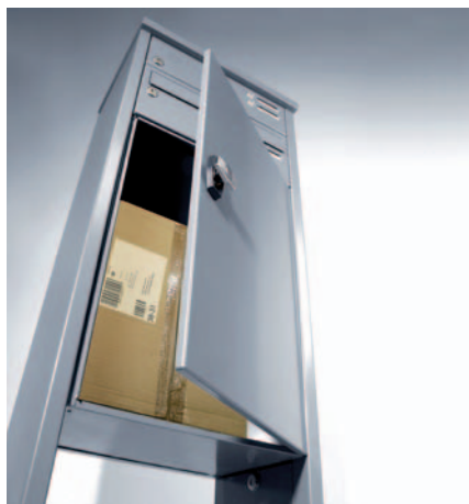
Depotbox von Renz: der Hausbriefkasten für Pakete

Sendungslogistik bei großen Hauspost-Organisationen eingesetzt. Passend zu den klimaneutral produzierten Umschlägen und Verpackungen gibt es auch die „grüne“ Logistikleistung. Nachdem schon in der Vergangenheit die Deutsche Post hier mit einem breiten „GoGreen“-Sortiment vorangegangen ist, bietet jetzt auch TNT klimaneutrale Versendungsleistungen an. Bei großen Paketkunden, insbesondere im Distanzhandel, geraten die Retouren-Konditionen ins Fadenkreuz. Im Sommer 2009 haben wir diesen Kosten- und Serviceblock selbst ins Visier genommen. Diese höhere Aufmerksamkeit und der verschärfte Konkurrenzkampf haben jetzt dazu geführt, dass fast alle Paketdienste in den letzten Monaten bessere Angebote gemacht haben. Dabei geht es nicht nur um Kosten, sondern auch um praxistaugliche Lösungen. Eine der neuesten Ideen ist der Online-Retourenschein von DHL, den man nicht mehr als Aufkleber mitschicken muss; der Rücksende-Kunde kann ihn sich einfach aus dem Internet herunterladen. In anderen Ländern gibt es bereits das Heilmittel gegen unzustellbare Pakete: den Eingangs-Paketkasten, in den man größere Sendung einwerfen oder -legen