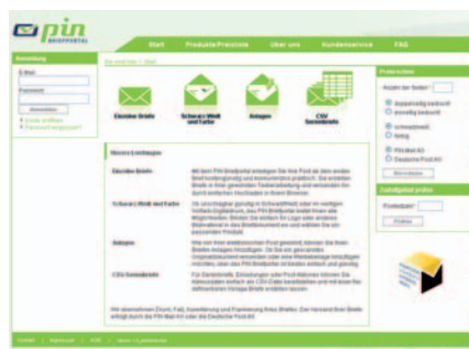
Trendgemäß: Online-Briefportal von Pin

Eine erstaunliche Karriere haben die Online-Briefportale in diesem Jahr gemacht. Wer diese Web-to-Print-Lösungen für Briefe und Rechnungen hauptsächlich als Lösung für kleine Gewerbetreibende gesehen hat, dem werden heute bei fast allen Portalbetreibern auch anspruchsvolle Managementlösungen für mittlere und große Kunden angeboten, mit denen der komplette