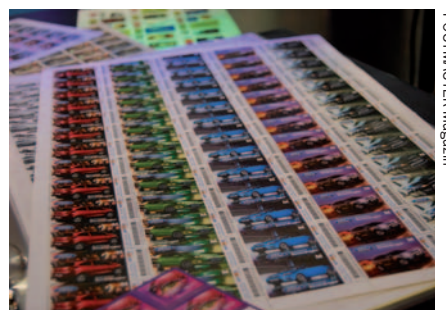
Von CDS: kundenspezifische Briefmarken, schon mit Barcode

hat das Jahr 2009 ebenfalls einige attraktive Innovationen gebracht. Da sind die Barcode-Briefmarken von CDS, bei denen die Kodierung kundenspezifisch vergeben und beim Posteingang in der Sortiermaschine erkannt wird. Der Clou: Die Marken müssen nicht bezahlt werden, sondern werden erst nach dem Einsatz auf der Sendung abgerechnet. Außerdem kann man hier beliebige Bilder als Markenmotive einsetzen. Die Wertzeichen sind nicht nur bei deutschen Brieflogistikern im Einsatz, sondern auch bei einigen ausländischen Staatspost-Gesellschaften. Die bei den neuen Briefdiensten führende Softwarelösung PostOffice von CodX