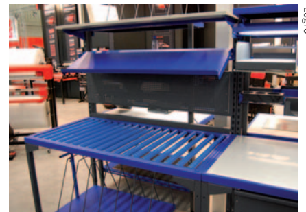
Individuell zusammengestellter Packplatz: die Eco-Serie von Legro

Packmittel-Bevorratung, Waage, PC und Etikettendrucker zu bieten hat, bekommt man jetzt bei Legro. „Legro Eco“ ist so praktisch konstruiert, dass man sie leicht selbst aufbauen kann.