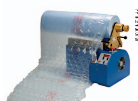
FP International: breite Luftpolsterfolien „on demand“

breite Luftpolster-Folien an der Packstelle hergestellt werden können. Diese dienen nicht nur der Auffüllung von Hohlräumen; es können auch komplette Produkte darin eingeschlagen werden.