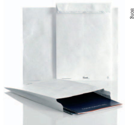
Tyvek wird ab 2010 bei Bong hergestellt.

Beim Versender Rajapack gibt es jetzt Kartonagen in Maßarbeit per Mailorder. Mit seinem ProPac-Programm wird Bong immer mehr zum Schwerpost- und Verpackungs-Spezialisten im Postbüro. Ab 2010 werden auch die beliebten reißfesten Hüllen und Verpackungen aus Tyvek bei den Wuppertalern gefertigt. Bei regelmäßig pendelnden hochwer-