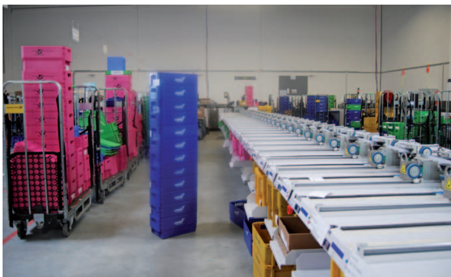
Bunt geht es zu im Citipost-Briefzentrum Hannover.

Briefe kommen in der Videocodierung auf den Bildschirm, wo sie manuell nachbearbeitet werden, so dass auch in diesen Fällen dem Barcode eine Adresse zugeordnet ist. Ab dem späten Abend können alle Partner ihre fertig zusammengestellten Kisten bekommen. Internationale Post holt die Swiss Post ab.