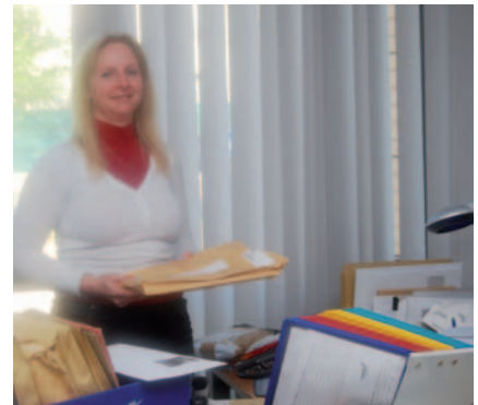
Retouren: neu zugestellt oder mit aktueller Adresse zurück

senderweise in Hannover. Die Zeitungszusteller haben in der Regel Zugang zu Schlüsselhäusern, bei denen die Briefkästen jenseits der Haustür angebracht sind, und so erhalten die Hannoveraner den blauen Teil ihrer Post schon früh mit der Tageszeitung. Später am Tag gibt es einen zweiten Zustellgang mit Premiumpost wie Einschreiben und PZA. Von den täglich 200 000 Citipost-Briefen sind durchschnittlich 3000 nicht zustellbar; Umzug der Adressaten ist der häufigste Grund. Diese Retouren werden in einer separaten Abteilung bearbeitet. Hier wird nach Möglichkeit die aktuelle Adresse ermittelt, und weil ja jeder Brief registriert und einem Kunden zugeordnet ist, kann direkt festgestellt werden, ob der Versender den Brief mit neuer Adresse zurück haben möchte oder ob